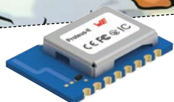
Proteus-II Bluetooth® Low Energy 5.0 (siehe S. 12) RS Best.-Nr.: 205-9928

Klar, passend zum Thema habe ich ein interessantes Produkt von Würth Elektronik gesehen, die Proteus-I/-II Bluetooth Module werden bei der Entwicklung von Hard- und Software z. B. im Bereich Zutrittskontrolle verwendet.