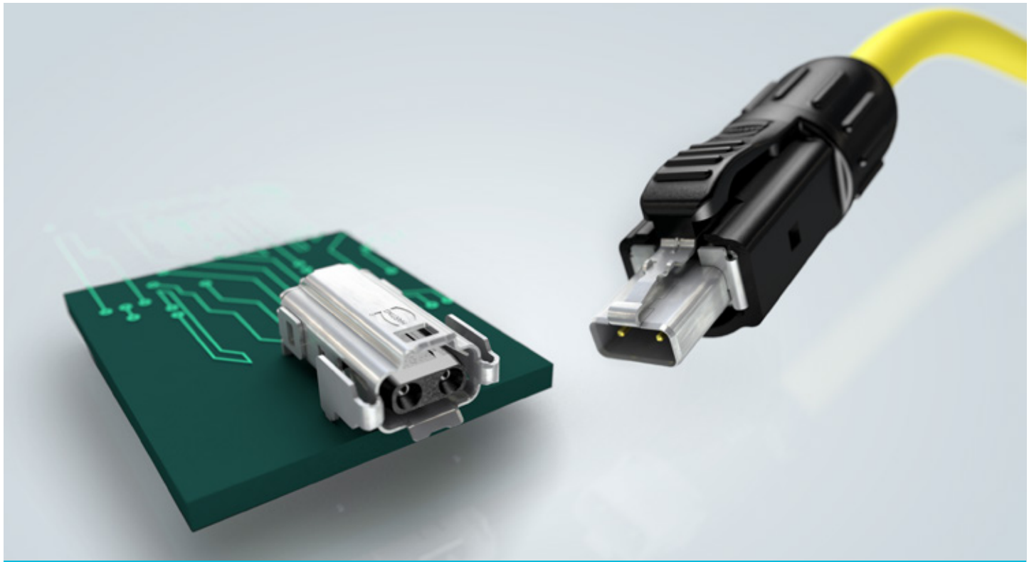
Bild 2. Harting T1 nach IEC 63171-6. (Bild: Harting Technologiegruppe)

Für Industrie-Anwendungen hat Harting, Mitglied im SPE Industrial Partner Network, Verbindungselemente mit einem Steckgesicht nach IEC 63171-6 (Bild 2) entwickelt. Dieser SPE-Steckverbinder kann sowohl 1GBit/s für kürzere Strecken als auch 10MBit/s für die weiten Distanzen realisieren.